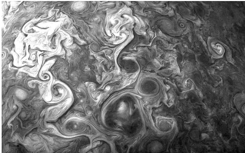
Рис. 4. Мощные вихревые потоки облачного покрова Юпитера

. Для научного сообщества непреодолимым препятствием для принятия гипотезы извержения комет, является невообразимо высокие скорости, порядка \sim 60 км/с, необходимые для выброса комет за пределы поля тяготения Юпитера. Это препятствие является для ученых красной линией, переступить которую пока не представляется возможным. Обычно говорят, что нам неизвестны антигравитационные процессы такого масштаба, но это не значит, что такие природные процессы вообще отсутствуют. Вероятнее всего, мы их просто не знаем, но есть уверенность, что в ближайшее время такой процесс будет открыт! Однако, если проанализировать все имеющиеся доводы в пользу гипотезы извержения комет, то она не покажется столь фантастична, так как слишком многое объясняет. Выбросы вещества с поверхности Юпитера уже наблюдались В.К. Всехсвятским в 1963-1964 г.г.[5], а на снимках космического зонда «Юнона» облачного покрова Юпитера зафиксированы мощные вихревые процессы, благодаря которым вполне возможны выбросы вещества, подобно солнечным протуберанцам.