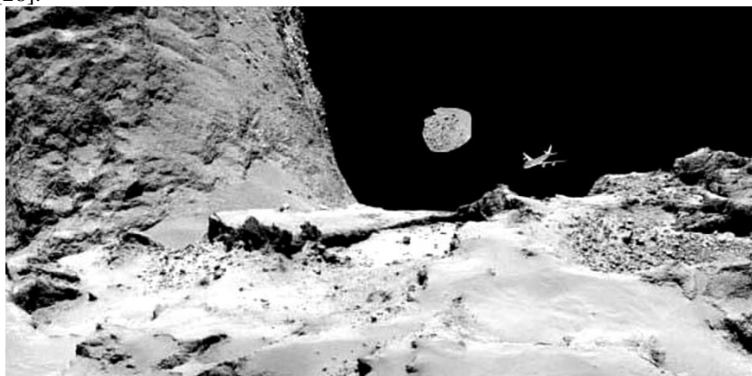
Рис. 3. Сравнительные размеры Боинга 747, Тунгусского метеороида и кометы 67P (сайт http://www.esa.int/Our_Activities/Space_Science/Rosetta )

Прямые исследования короткопериодической кометы системы Юпитера 67P/Чурюмова-Герасименко, проведенные космическим аппаратом ЕКА Розетта, позволили получить огромный объем интереснейшей информации, которая дала возможность впервые увидеть в «лицо» ядро кометы, и в значительной мере изменить существующее представление о кометных ядрах. Совершенно неожиданным оказалось, что ядро представляло собой нагромождение крупных и мелких обломков. Ее внешний вид оказался чрезвычайно схож с пейзажами, встречающимися на Земле [32]. Замеренная плотность ядра составила 470 \text{ кг/м}^3 , что обусловлено ее высокой пористостью пород и наличием крупных пустот. Такое ядро никак не могло образоваться путем аккумуляции из протопланетного диска, а представляла собой, скорее всего, фрагмент коры железокаменного тела планеты-гиганта, что собственно соответствует первому положению кометной метеоритики [28].