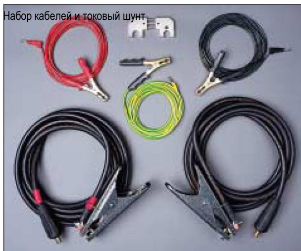
Набор кабелей и токовый шунт

Показывает значение измеренного сопротивления или величину напряжения. Переключение с помощью кнопки <Ω>